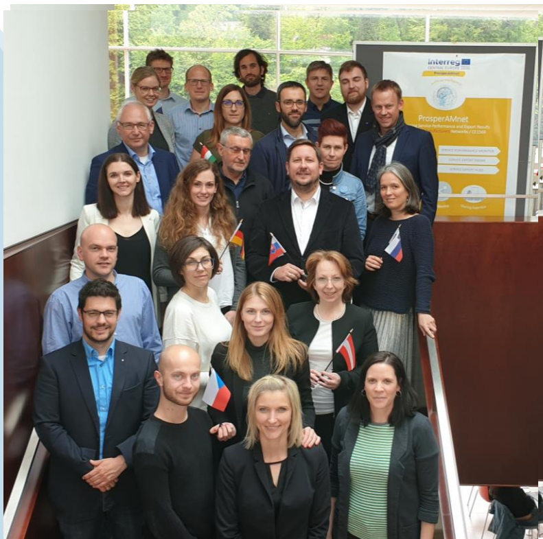
Skupinska fotografija projektnih partnerjev ProsperAMnet z uvodnega srečanja 6. In 7. maja 2019